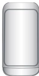
Apparato da esterno

Sarà il tecnico incaricato dell'attivazione ad occuparsi della configurazione.